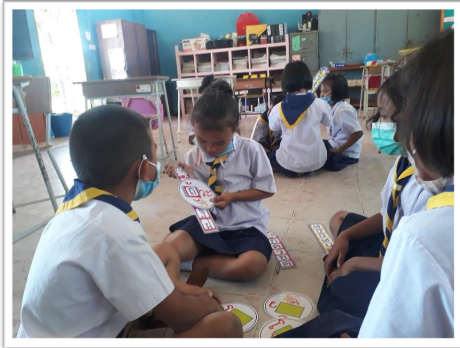
นักเรียนใช้นวัตกรรม