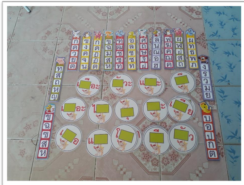
ภาพนวัตกรรมการไม้บรรทัดสะกดคำ