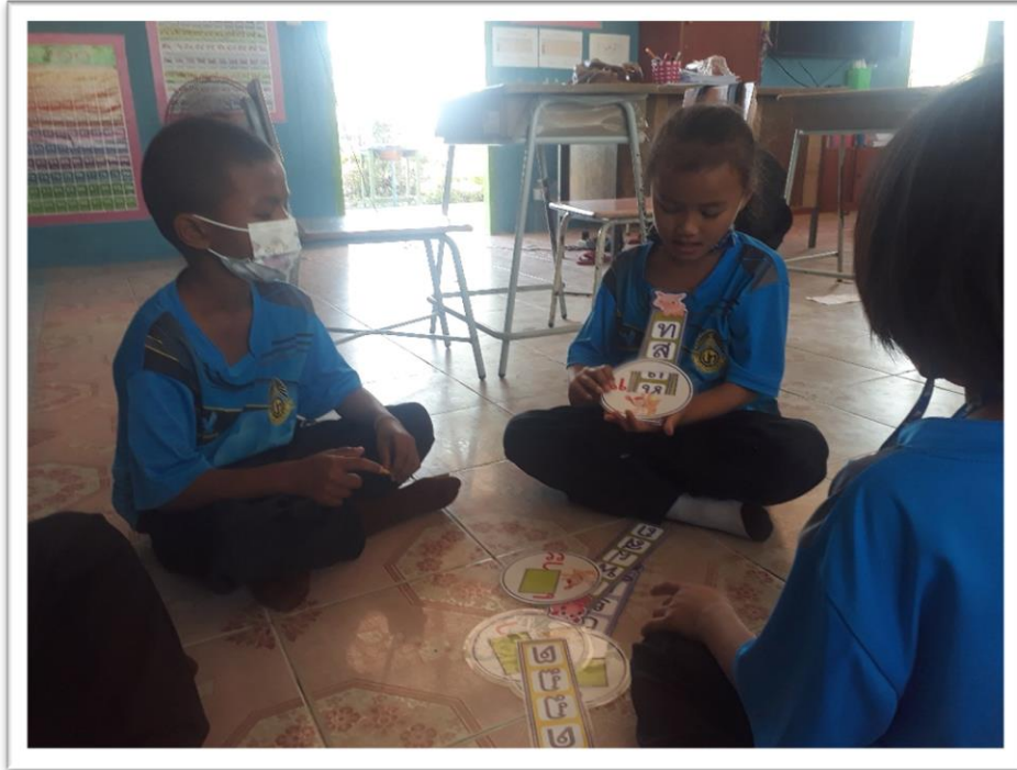
นักเรียนใช้นวัตกรรม