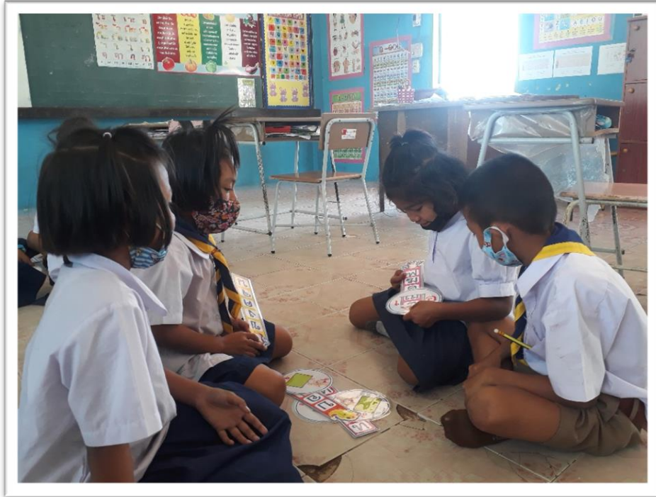
นักเรียนใช้นวัตกรรม