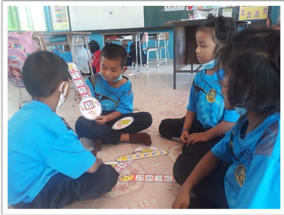
นักเรียนใช้นวัตกรรม